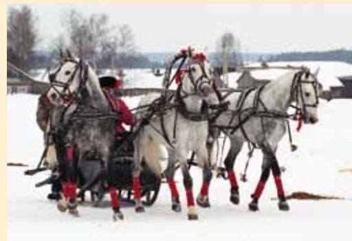
Russische Troika

Bei der Troika hält der Fahrer je zwei einzelne Leinen in jeder Hand, von denen die zwei mittleren zum Mittelpferd gehen. Je eine führt zum äußeren Trenserring der Galopper, der zudem mit einem Ausbindezügel an der „Dugá“ (Krummholz) befestigt ist. Bei nachgebender Leine sind die äußeren Pferde geradegerichtet, bei strammer Leine werden die Pferdeköpfe nach außen gedreht, was nicht sehr Pferde gerecht ist.