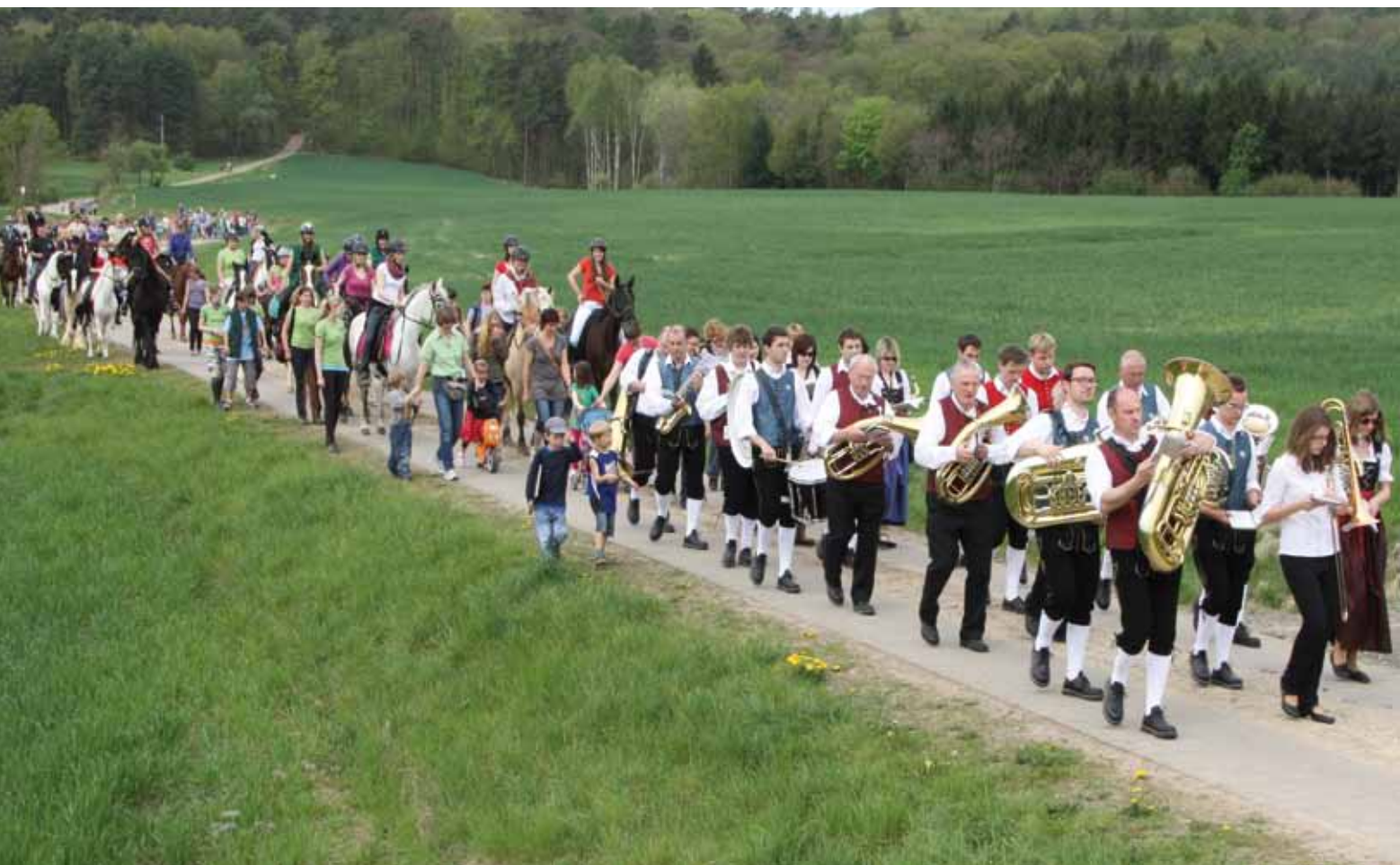
Foto: Erster St. Georgen Ritt und Tag der offenen Tür in Baunach bei Pferdepartner Franken e.V.